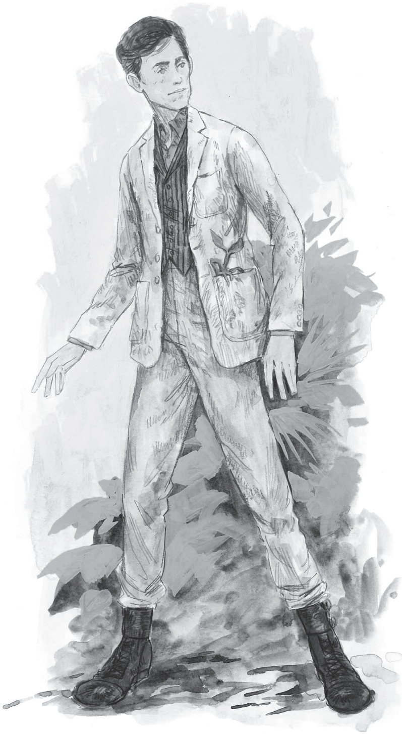
NEWT SCAMANDER KOSTÜM ESKİZİ