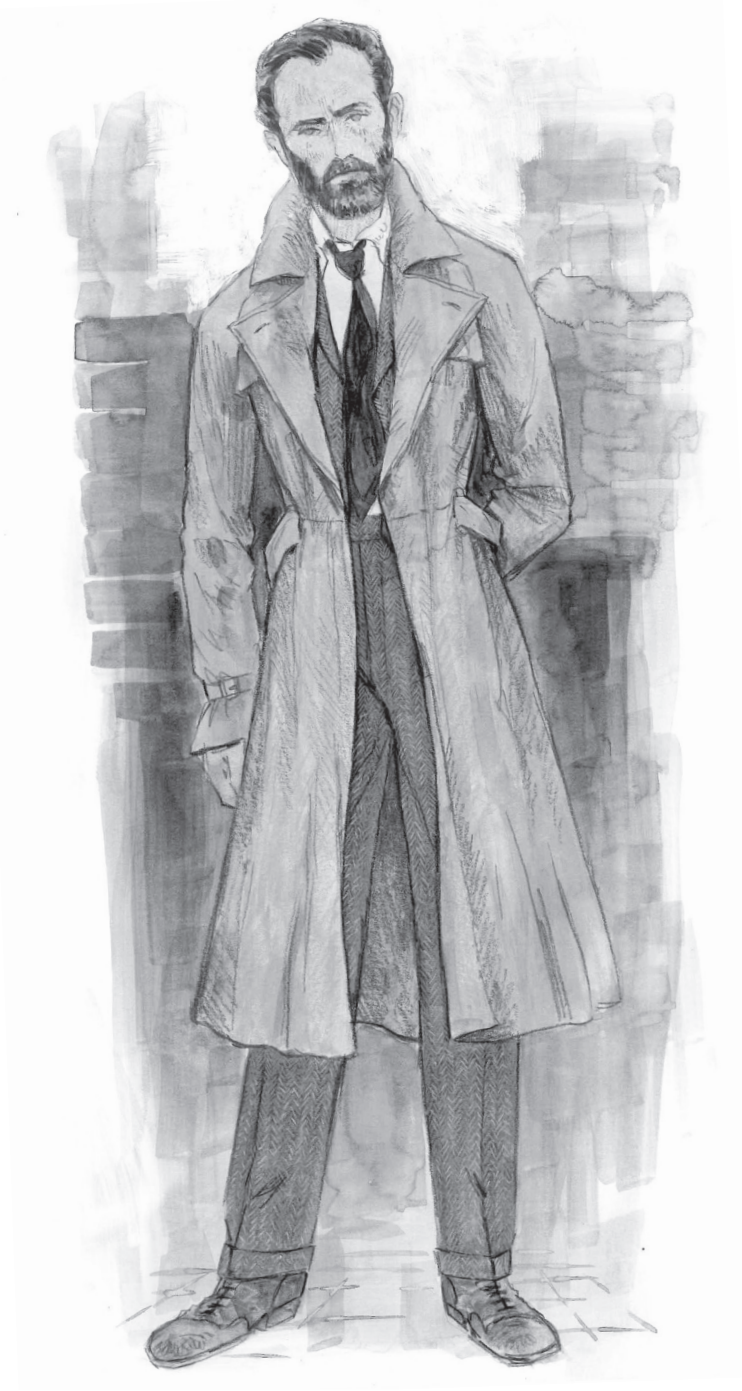
ALBUS DUMBLEDORE KOSTÜM ESKİZİ (KARŞIDA) ALBUS DUMBLEDORE'UN DOSYASININ İLK TASLAK TASARIMI, HAREKETLİ FOTOĞRAF İÇİN YER BIRAKILMIŞ.