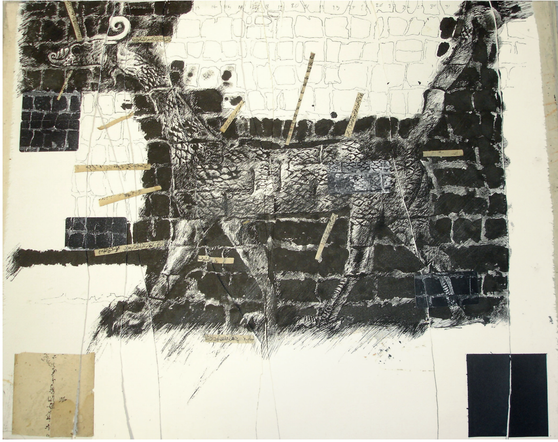
0.5 Hanaa Malallah, The God Marduk , 2008. Sanatçı kitabı, kâğıt üzerine karışık teknik (60 x 46 cm).