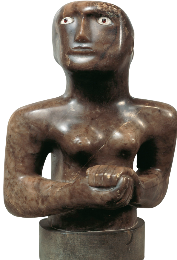
0.1 Henry Moore, Girl with Clasped Hands , 1930. Cumberland alabasteri (yük. 42,5 cm).

Moore'un İsviçreli çağdaşı Alberto Giacometti ise ilham kaynaklarından biri Sümer sanatı olduğundan,