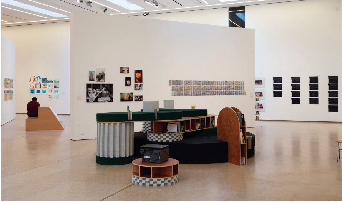
"Intimate Garden Scene" sergisinden.

mın sürdürülebilirliğini ve mekânımızın devamlılığını zorlaştırarak HWP'yi büyük baskı altına soktu. Ekim 2019 ayaklanmaları, ardından COVID-19 salgını ve derinleşen ekonomik kriz, bizleri eğitime yaklaşımımızı yeniden düşünmeye zorladı. 2019'dan 2021'e uzanan dönem, şimdiye kadar yaşadığımız en tedirgin edici sınavlardan bazılarını önümüze getirdi - sonuçta, kültür kurumu olsun olmasın hiçbir kurum krizlere bütünüyle dayanıklı olduğu iddiasında bulunamaz.