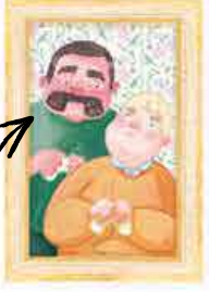
Vernon Enişte (sürekli yakını, özellikle de Harry'den)

Harry Potter bebekliğinden beri korkunç teyzesi, eniştesi ve kuzeniyle birlikte Privet Drive, Dört Numara'da yaşıyordu.