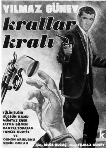
Krallar Kralı (1965) filminin afişi.

Neyse, Yılmaz'ı yatıştırdık ve yolumuza devam ettik. Belgrad Ormanları'nda çalışmaya başladıktan yarım saat sonra ormanın içinde bize doğru gelen dört-beş minibüs gördük. Minibüsler biraz ötede durdular ve eli sopalı kalabalık (şoförün arkadaşları) minibüsten fırlayıp bize saldırdılar. Müthiş bir kavga başladı.