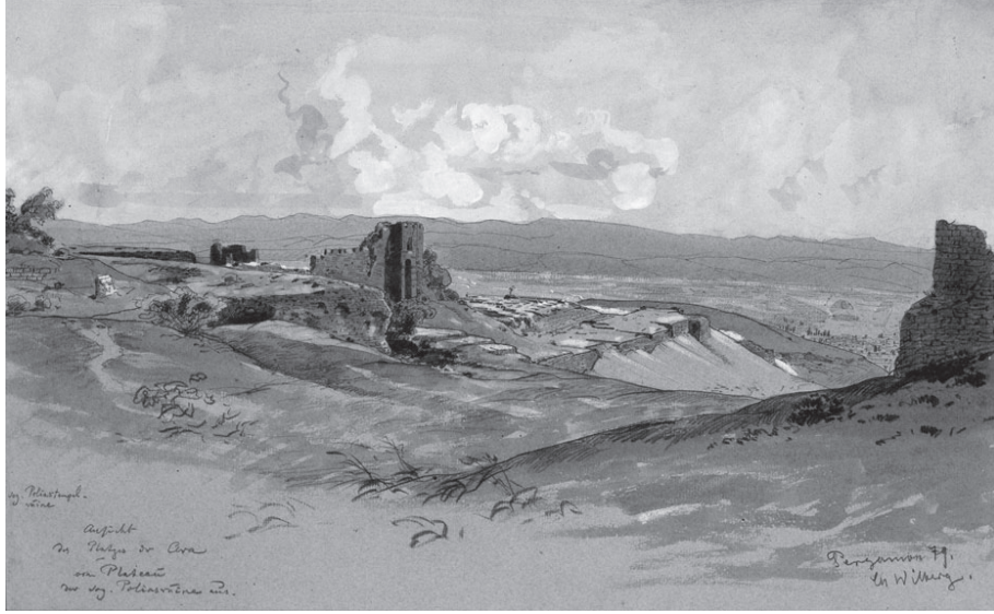
Fig. 2: “Polias harabeleri platosundan sunak alanının görünümü” Christian Wilberg; 1879 (Antikensammlung SMB Arşivi)

ları bulmak, sunağın temellerini açığa çıkarmak ve Traianus Tapınağı ile birlikte tepenin en üst kısmında bulunan platonun yüzeyini araştırmaktı.