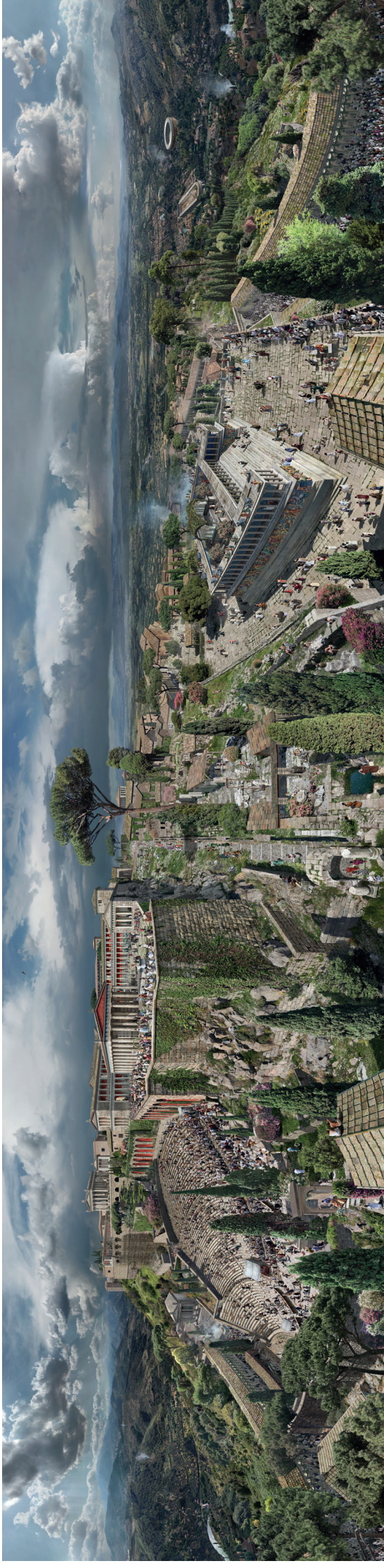
Pompeii - Antik Metropoliten Pompeii Yangar, Asst 2011