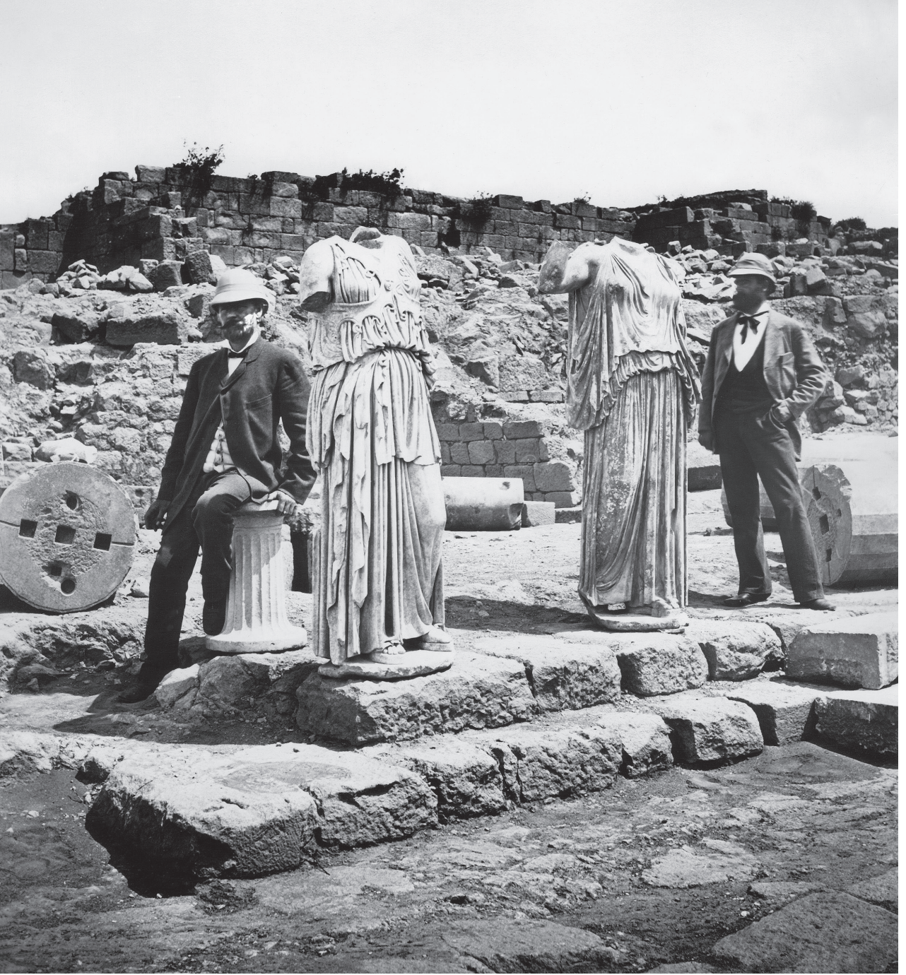
Fig. 1: Humann ve Bohn, "Çarpraz Aegisli Athena" ve "Hera" heykelleri ile birlikte Athena Kutsal Alanı stoaları önünde