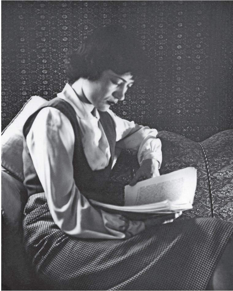
Nezihe Meriç, 1950.