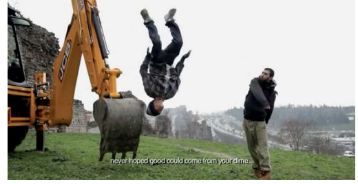
Halil Altındere Harikalar Diyarı , 2013 HD video, renk, ses, 8'24" Sanatçı ve Pilot Galerisi'nin izniyle

Eğer bu on iki kişiyi bir odaya kilitleyip İstanbul’da bugün yaşananlara dair bir hükme varmalarını isteseydik, muhtemelen çatışma çıkar ve karar da çekimsiz olurdu. Her sanatçıyla teker teker konuşarak şehrin dinamizmi ve karmaşasının bir kısmını kaçırmış olabiliriz, ama İstanbul hepsini kucaklayacak kadar büyük. Bu şehir aynı seslerin içinde dönüp durduğu bir hava boşluğundan çok, farklı fikirlerin bir arada fokurdadığı bir kazana benziyor. Dolayısıyla kitaptaki eserlerin farklı bileşenlerini, onları şekillendiren fikirleri ve duyguları incelemek kolay değil, ama son derece keyifli.