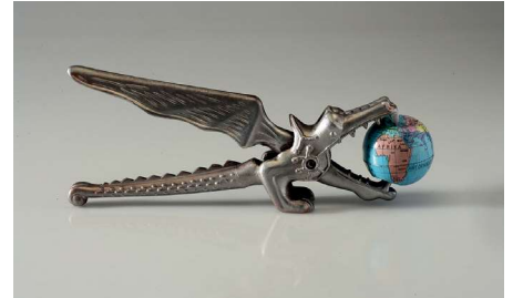
Hale Tenger World Cracker , 1992 Rus fındık kıracağı, oyuncak küre 7 x 22 x 4 cm Fotoğraf: Aziz Çelebi Sanatçı, Galeri Nev İstanbul ve Green Art Gallery, Dubai'nin izniyle

İnsan dünyada bir şeylerin ters gittiğini İstanbul bir soykırıma sahne olduğunda anlıyor. Şehir altın yıllarında hep çeşitliliği kucaklamış ve birçok farklı kültürün keşişim noktası olmanın faydasını görmüştü. Bu durum tek bir ülkenin değil, farklı imparatorlukların başkenti olduğu zengin tarihinden kaynaklanıyordu. Sanatçılar genelde siyasetçi kimliği