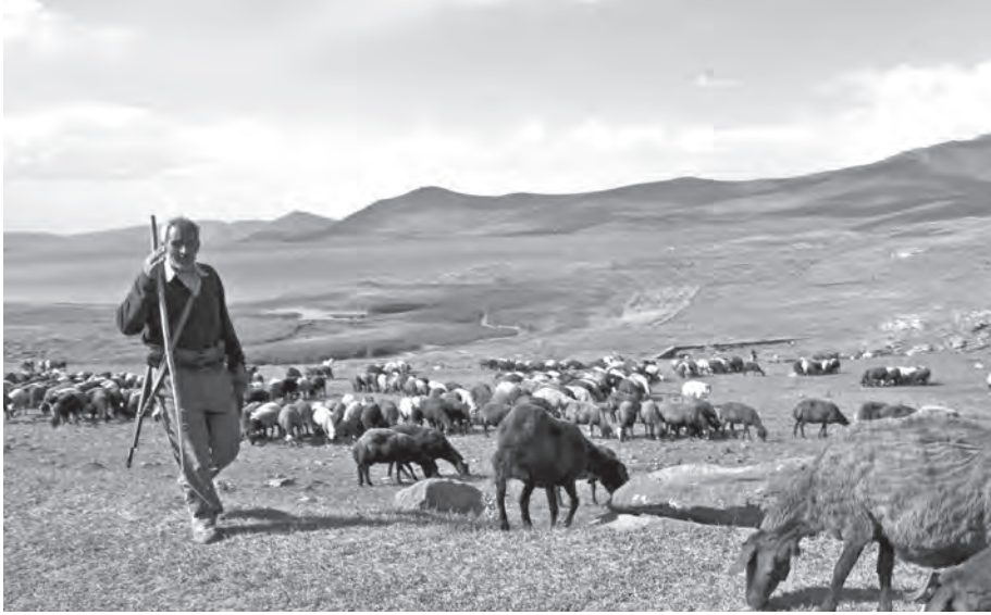
Fig. 3: Doğubayazıt'ta deniz seviyesinden 2300 m yüksekte Balıkgölü'nde bir sürü. Doğu Anadolu ve çevresinde yarı-göçebe yaşam biçimi günümüze kadar yaygın biçimde sürdürülmektedir. Yaz aylarını yüksek yaylalara çıkan göçerler, kışı daha alçak bölgelerde geçirmektedirler.

ri olduğunu gösteren izlerden yoksunuz. Bu durum sözkonusu toplumların daha çok yaylak ve kışlaklar arasında yarı-göçebe bir yaşam sürdürdüklerini göstermektedir (Fig. 3-4).