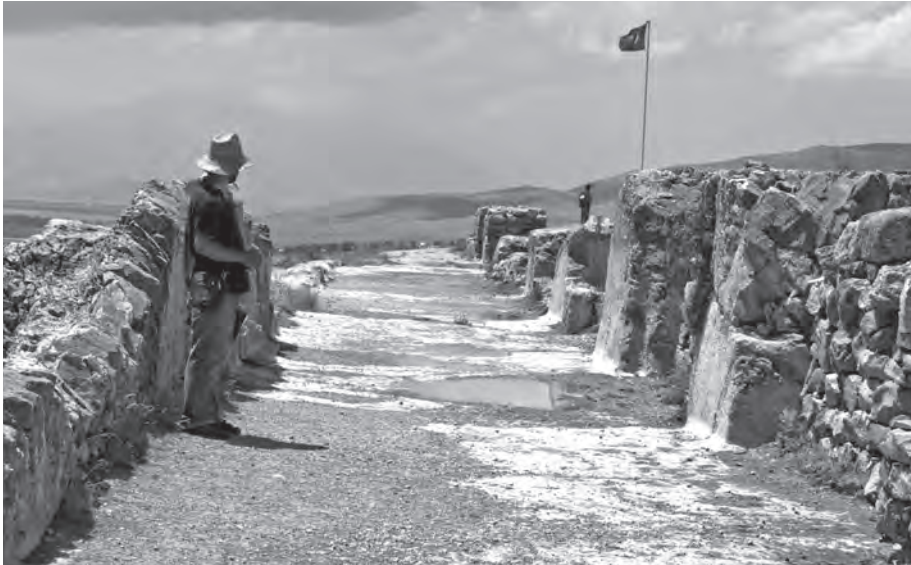
Fig. 7: Çavuştepe sitadelinin yapıldığı yüksek kayalık, yapılar inşa edilmeden önce belirgin bir biçimde kesilerek altyapı oluşturulmuştur. Düzleştirilen kayalık içine derin sarnıçlar oyulmuştur.

Kentlerin çoğu sitadel için inşa edilmiş gözükse de herbirinde bir aşağı kentin/yerleşmenin varlığı anlaşılmaktadır. Ancak bunlardan çok azının aşağı kenti konusunda araştırma yapılmıştır (Stone 2005; Stone, Zimansky 2009).