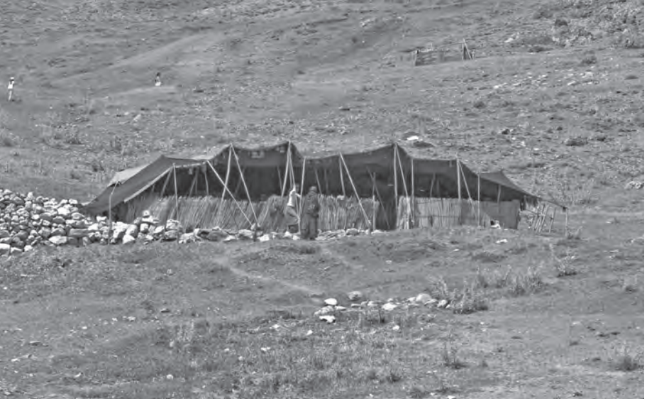
Fig. 4: Yarı-göçebe toplumlar yaz aylarında geleneksel kara çadırlarda konaklamaktadır. Bu çadırların kurulduğu alanda ve yakın çevresinde taştan yapılmış daha kalıcı basit mekânlar oluşturulduğu görülmektedir.

dı (Russell 1984). Assur yazıtlarında, başarının yüceltilmesi adına bu geniş dağlık alandaki aşiret reislerinin kral olarak tanımlandığı anlaşılmaktadır. I. Tiglat-pileser (1114-1076) bu sözde kralların sayısını 60'a kadar çıkarmaktadır (Zimansky 1985: 48-50; Salvini 2006: 28-34).