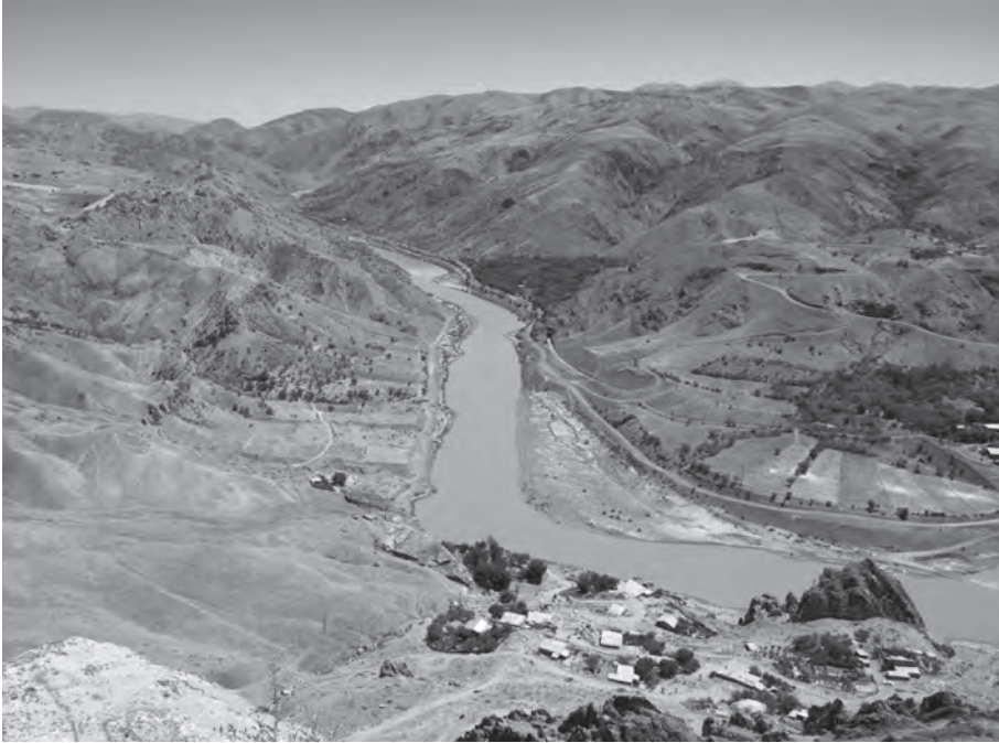
Fig. 2: Palu Kalesi'nden Murat Nehri Vadisi. Urartu ülkesi genellikle derin vadiler ve yüksek dağ sıralarından oluşur. Urartu merkezlerinin çoğu bulunduğu bölgeye hâkim ve stratejik noktalarda kurulmuşlardır.

Krallık kuzeydoğuda Aragats Dağı'nın güneyi ile Sevan Gölü'nün batısındaki verimli ovaya yerleşmek için büyük yatırımlar yapmıştır (Biscione 2003). Burada Armavir (Argıştihinili), Arin-berd (Erebuni) ve Karmir-Blur (Teişebai URU) adlı üç büyük kralî kent kurulmuştur (Piotrovskii 1969; Forbes 1983). Aragats Dağı'nın kuzeyindeki Gulijan, Sevan Gölü kıyısındaki Lçaşen, Tsovinar ve Tsovak gibi yazıtlar (Salvini 2008