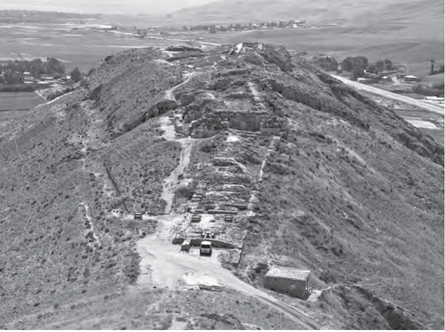
Fig. 6: Çavuştepe sitadelinin Uçkale bölümü, doğudan. Surların kayalık yamaçlara açılan teraslara yapıldığı görülmektedir.

değişen 12 merkezin bizzat devlet tarafından planlanıp inşa edilmiş, Urartu'ya özgü kent modeli olduğunu düşünmekteyiz.