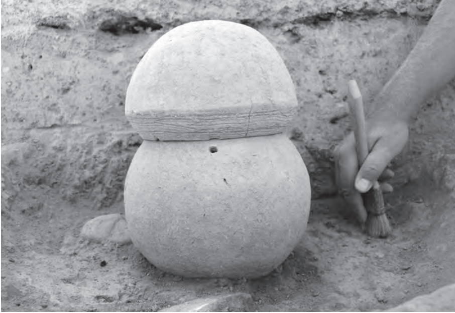
Fig. 5: Diyarbakır/Ziyaret Tepe'de bulunan içine kremasyon (yakarak gömü) yapılmış bir urne ve kapak olarak kullanılan ağız kenarı yiv bezemeli çanak.

yüzyıl ve sonrasına ait olduğu kabul edilmiştir (Winn 1980; Bartl 2001; Müller 2005).